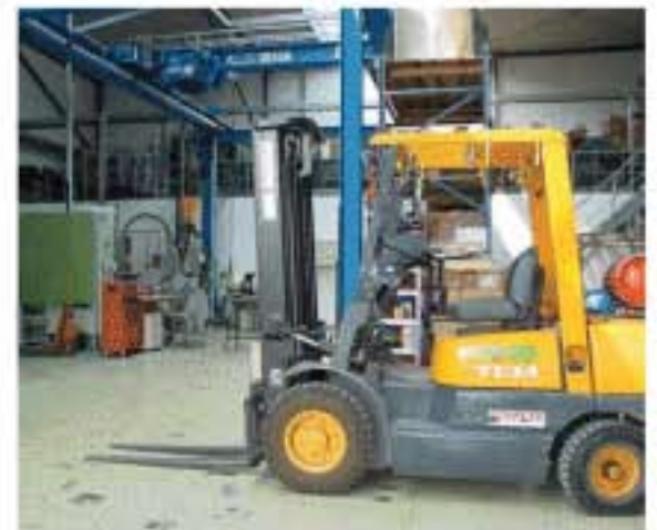
Reloverdichter GmbH Bautzen