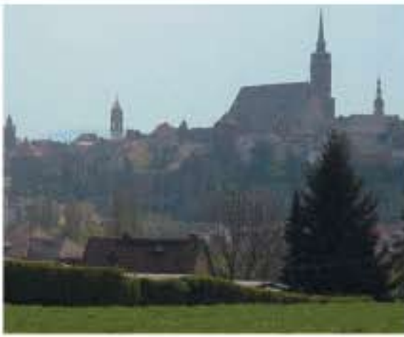
Bautzen in Ostsachsen

um für das Unternehmen angepasste Lösungen zu finden.